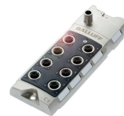
Sensor-/Aktorhub zum Anschließen binärer und/oder analoger Sensoren und Aktoren

Der IO-Link-Master ist das Herzstück der IO-Link-Installation. Er kommuniziert über den jeweiligen Feldbus mit der Steuerung und nach unten über IO-Link mit der Sensor-/Aktorebene (Gateway).