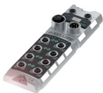
8-Port-IO-Link-Master für Profinet zum Anschließen von bis zu 8 IO-Link-Geräten