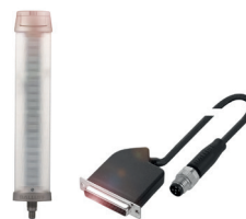
Auswahl IO-Link-fähiger intelligenter Aktoren (hier: Signalleuchte und Ventilinselstecker)