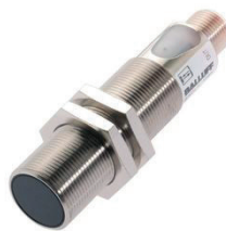
Optoelektronischer Sensor zur Erfassung nichtmetallischer Objekte aus sehr großer Entfernung