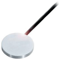
Kapazitiver Sensor zur Erfassung nichtmetallischer Objekte im Nahbereich

Optoelektronische Sensoren prüfen die Anwesenheit von Photovoltaikzellen oder anderen Objekte während ihrer Zuführung. So unterstützen diese die Prozesskontinuität. Optoelektronische Sensoren sind einfach installierbar und verschleißfrei.