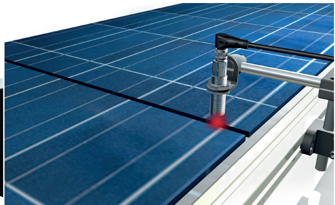
Optoelektronische Sensoren erfassen berührungslos Photovoltaikzellen im Produktionsprozess.

Kapazitive Sensoren erfassen die Höhe von Papierstapeln oder von anderen nichtmetallischen Materialien. Dadurch stellen diese sicher, dass der Druckprozess reibungslos abläuft. Sie vermeiden den Transportstau und gewährleisten, dass es jederzeit Nachschub gibt. Kapazitive Sensoren benötigen wenig Platz und bedürfen keiner Zusatzteile, z.B. Reflektoren.