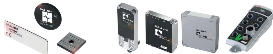
Datenträger in verschiedenen Ausführungen für diverse Behältertypen

Durch diese umfassende Transparenz können Sie die Prozesskette optimieren – einschließlich der Materialversorgung durch Ihre Zulieferer. Die durchgängige Datenerfassung ermöglicht ebenso gezielte Korrekturmaßnahmen.