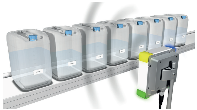
Individuelle Kennzeichnung des einzelnen Produkts und gleichzeitige Erfassung mehrerer Datenträger mit UHF-RFID

Im Materialfluss sind die Anforderungen an die Datenerfassung vielfältig: Behälter müssen auf Förderstrecken erfasst und Produkte auf Paletten registriert werden, wenn sie eine Werkshalle durch ein Tor verlassen.