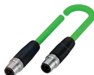
Feldbuskabel zur Vernetzung des IO-Link-Masters mit der SPS oder weiteren Feldbusteilnehmern