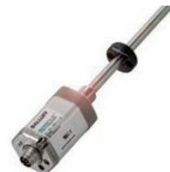
Sensor magnetostrictivo de posición lineal de alta precisión, ideal para su uso en cilindros hidráulicos

Por ejemplo, las siguientes tecnologías de sensores resultan ideales para la medición de posición lineal: