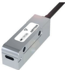
Encoder magnético que gracias a su extraordinaria precisión, resulta ideal para accionamientos lineales.

En una máquina herramienta el estado de sujeción de un husillo debe ser monitoreado continuamente durante el mecanizado para mejorar los resultados en la pieza de trabajo y aumentar la fiabilidad del sistema global. Los sistemas inductivos de posicionamiento proporcionan retroalimentación continua al controlador para informarle si el husillo está suelto, sujeto con herramienta o sujeto sin herramienta.