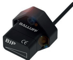
Sistema inductivo de medición de posición cuya repetibilidad y linealidad resultan ideales para aplicaciones como, el monitoreo de las pinzas de sujeción.