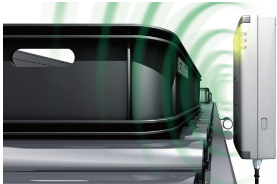
Leer y escribir información de portadatos en contenedores de carga pequeños con RFID de alta frecuencia (HF) para un seguimiento completo

La intralogística controla el flujo de material entre diversas partes de la fábrica, desde la entrada de mercancía, el almacén, las zonas de producción y ensamble final, hasta la recogida de productos y el envío. Para garantizar un seguimiento continuo de todos los pasos del proceso (trazabilidad), los materiales utilizados deben estar marcados. Esto lo hacen posible los códigos de barras y soportes de datos RFID que se pueden utilizar varias veces y se pueden colocar en sus contenedores y pallets.