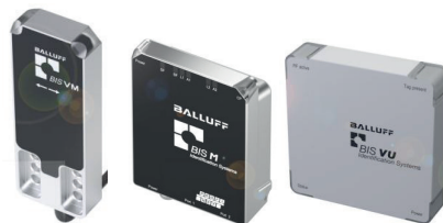
Cabezales de lectura/escritura HF, aparato de lectura/escritura HF y antena UHF para diversos entornos y distancias