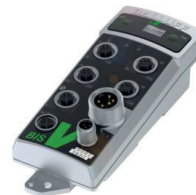
Procesador independiente de la frecuencia de un sistema RFID para accionar varios cabezales de lectura/escritura o antenas

Al seleccionar la tecnología RFID correcta se debe establecer si tiene una aplicación estacionaria con distancias de lectura cortas, o si desea una aplicación dinámica con rango de lectura de varios metros y la recopilación simultánea de múltiples objetos (multi-tagging). La aplicación estacionaria se logra con HF (alta frecuencia) y la dinámica con UHF (ultra-alta frecuencia).