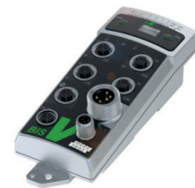
Unité d'exploitation indépendante de la fréquence d'un système RFID destiné à l'exploitation de plusieurs têtes de lecture/écriture ou antennes

La gestion du matériel, tels que les outils, les moules d'injection, etc., imposent des exigences spécifiques à l'application aux caractéristiques des composants RFID :