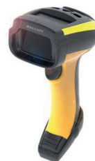
Lecteur portatif mobile destiné à la lecture de codes à barres 1D et 2D