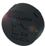
Support de données, conçu spécialement pour l'identification d'outils, montable directement sur le métal

Les tags RFID sont également installés sur les moules d'injection et les outils de découpage. Ces supports de données fournissent des informations sur les paramètres de réglage, ainsi que des données concernant l'utilisation, la maintenance et l'affectation à la machine, dans laquelle ils sont utilisés. Un appareil de lecture/écriture RFID lit les données et les transmet à la commande machine. Ce principe rend possible la surveillance d'état et la maintenance prédictive.