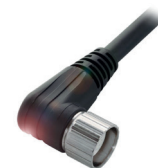
Connecteur en M23 entre le répartiteur passif et l'API

Il existe un grand nombre de répartiteurs passifs. Ils sont distingués, par exemple, selon les caractéristiques suivantes : version (M8 ou M12), type de raccordement à l'API (câble, capot ou connecteur) et nombre d'emplacements (4 à 10). Ils sont en matière plastique. Une LED vous informe sur l'état des appareils raccordés.