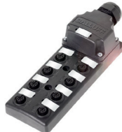
Répartiteur passif en M12 avec raccordement par capot et câble (8 emplacements)