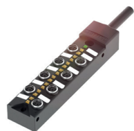
Répartiteur passif en M8 avec raccordement par câble (8 emplacements)

Les répartiteurs passifs sont équipés de LED d'état, qui affichent l'état de l'appareil. Ce concept facilite la localisation des défauts dans une installation.