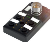
Répartiteur passif en M12 avec raccordement par connecteur (4 emplacements)