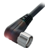
Connecteur en M23 entre le répartiteur passif et l'API

Il existe un grand nombre de répartiteurs passifs. Ils sont distingués, par exemple, selon les caractéristiques suivantes : version (M8 ou M12), type de raccordement à l'API (câble, capot ou connecteur) et nombre d'emplacements (4 à 10). Ils sont en matière plastique. Une LED vous informe sur l'état des appareils raccordés.