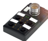
Répartiteur passif en M12 avec raccordement par connecteur (4 emplacements)