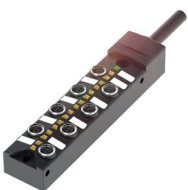
Répartiteur passif en M8 avec raccordement par câble (8 emplacements)

Les répartiteurs passifs sont équipés de LED d'état, qui affichent l'état de l'appareil. Ce concept facilite la localisation des défauts dans une installation.