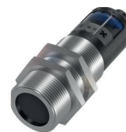
Capteur à ultrasons destiné à la détection d'objets, doté d'une surface réfléchissant le son, à grande distance

Selon le champ d'application, vous pouvez utiliser différentes technologies pour la détection des objets non métalliques :