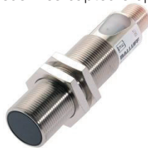
Capteur photoélectrique destiné à la détection d'objets non métalliques à très grande distance