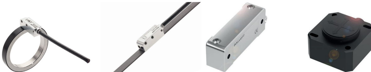
Système de mesure de déplacement à codage magnétique pour rotations illimitées, constitué d'un anneau magnétique et d'un capteur

Sur une installation à cylindres paraboliques, la lumière du soleil est focalisée sur des cylindres paraboliques par l'intermédiaire de miroirs paraboliques, où elle est accumulée sous forme d'énergie thermique. Afin d'atteindre la puissance énergétique optimale, la position du miroir parabolique doit être réorientée en fonction de la position du soleil. Des capteurs d'inclinaison signalent la position actuelle du miroir parabolique à l'automate, qui le réajuste en conséquence.