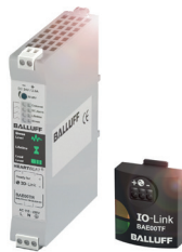
Bloc d'alimentation avec IO-Link (en IP20)