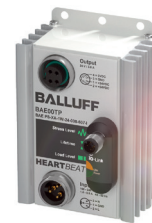
Bloc d'alimentation avec IO-Link (en IP67)

Outre les critères déjà cités, vous devriez tenir compte, lors du choix du bloc d'alimentation adapté, également de la température ambiante et – si nécessaire – effectuer des adaptations (p. ex. refroidissement). C'est la seule manière de garantir la performance maximale du bloc d'alimentation.