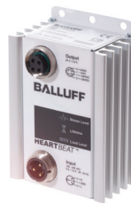
Bloc d'alimentation pour un usage directement sur le terrain (en IP67), y compris dans des environnements difficiles