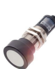
Sensor de ultrassom de medição de distância para todos materiais distantes até vários metros