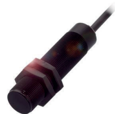
Sensor capacitivo de medição de distância para todos materiais distantes até aprox. 50 mm

Medição de distância, vão ou espaço são diferentes denominações para a mesma tarefa. Independentemente da denominação da tarefa, na indústria são utilizados diferentes sensores que se estabeleceram em conformidade com as suas propriedades técnicas: