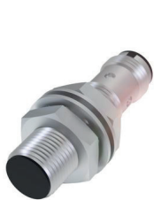
Sensor indutivo de medição de distância para objetos metálicos distantes até aprox. 50 mm

Em sistemas de enrolamento ou desenrolamento, um sensor optoeletrônico mede continuamente o diâmetro dos rolos, aumentando ou diminuindo. Independentemente do material dos rolos ou da cor. Isto permite trocar os rolos com períodos reduzidos de paralisação.