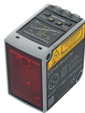
Sensor optoeletrônico de medição de distância para todos os materiais distantes entre poucos milímetros e vários metros