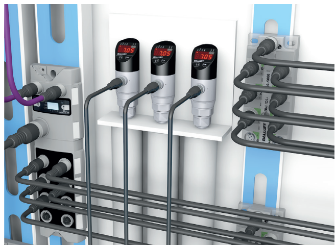
Conexão de um mestre IO-Link com hubs configuráveis IO-Link e sensores de pressão IO-Link

A transmissão de sinais dentro de uma máquina (entre sistema de sensores/de atuadores e PLC) ou também no conjunto do sistema (entre os PLCs) ocorre por meio de redes industriais. Estes permitem, entre outras coisas, uma comunicação por longas distâncias. Na indústria, um grande número de diferentes redes industriais se estabeleceu ao longo do tempo. Como o IO-Link é independente do barramento de campo, o nível do dispositivo com o IO-Link permanece inalterado - independentemente de qual barramento de campo você estiver usando.