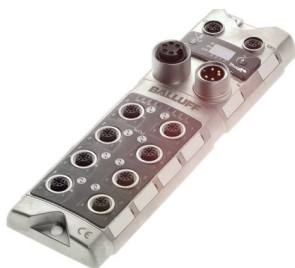
Mestre IO-Link em metal para aplicação descentralizada

A transmissão de sinais dentro de uma máquina (entre sistema de sensores/de atuadores e PLC) ou também no conjunto do sistema (entre os PLCs) ocorre por meio de redes industriais. Estes permitem, entre outras coisas, uma comunicação por longas distâncias. Na indústria, um grande número de diferentes redes industriais se estabeleceu ao longo do tempo. Como o IO-Link é independente do barramento de campo, o nível do dispositivo com o IO-Link permanece inalterado - independentemente de qual barramento de campo você estiver usando.