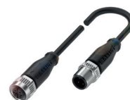
Cabo de sensor de três condutores para conexão dos sensores IO-Link

O mestre IO-Link está disponível para todos os redes industriais comuns. Ele possui uma entrada e uma saída para alimentação e para barramento de campo. Além disso, dependendo da área de aplicação, estão disponíveis portas em quantidades variadas.